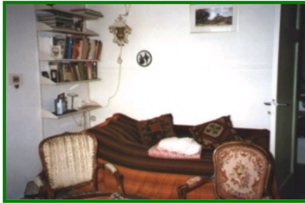
De slaapkamer van Margot en Anne Frank. Het logeerbed staat op dezelfde plaats waar Anne's bed gestaan heeft.